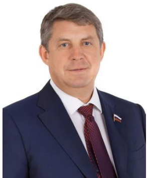
Глава Брянской области А.В. Богомаз

Решение создать семью, стать мамой и папой – ответственный и важный шаг! Рождение нового человека изменит уклад вашей жизни, повлияет на демографическую ситуацию в Брянской области и России.