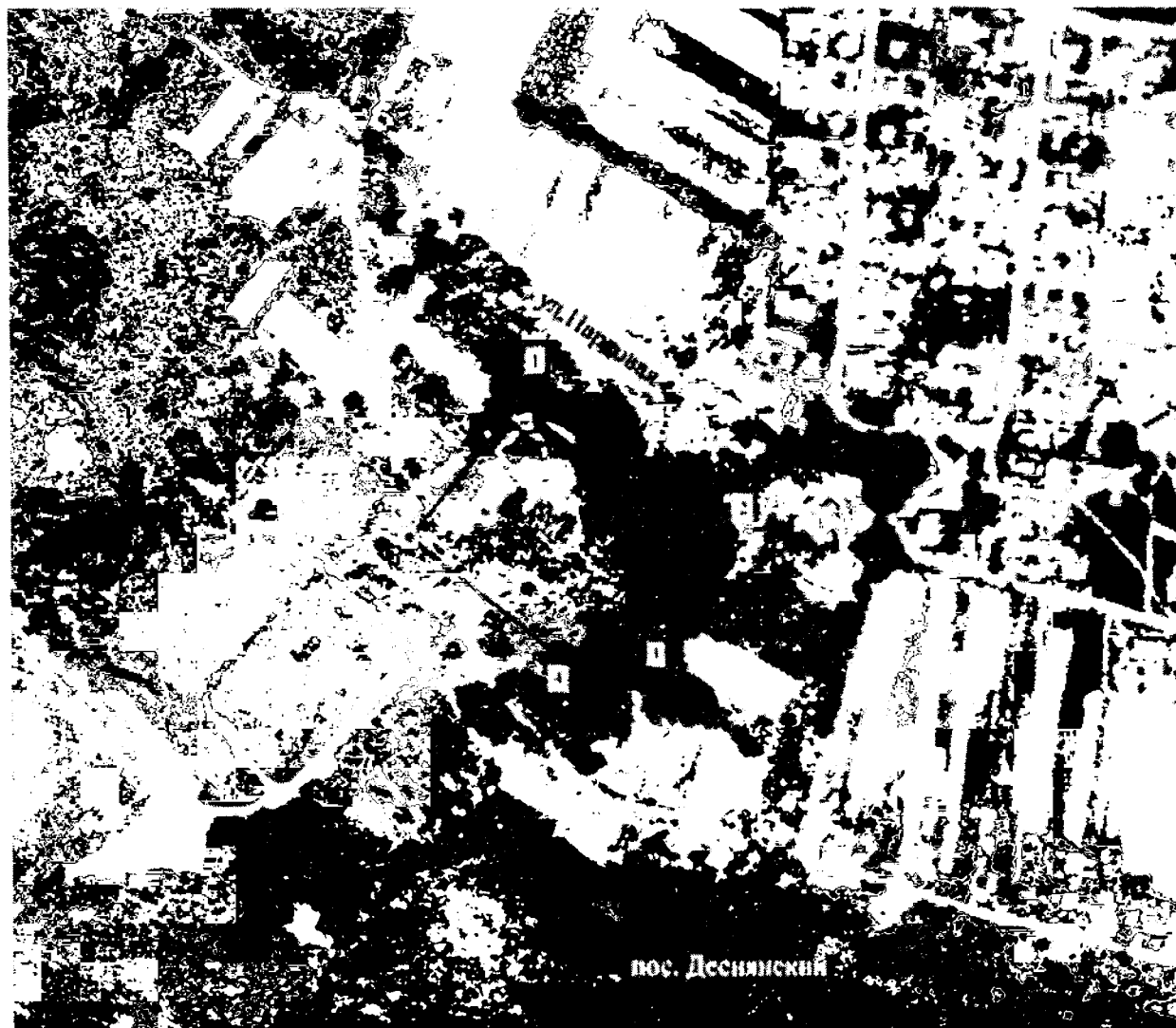
Схема границ территории объекта культурного наследия регионального значения «Усадебный дом»